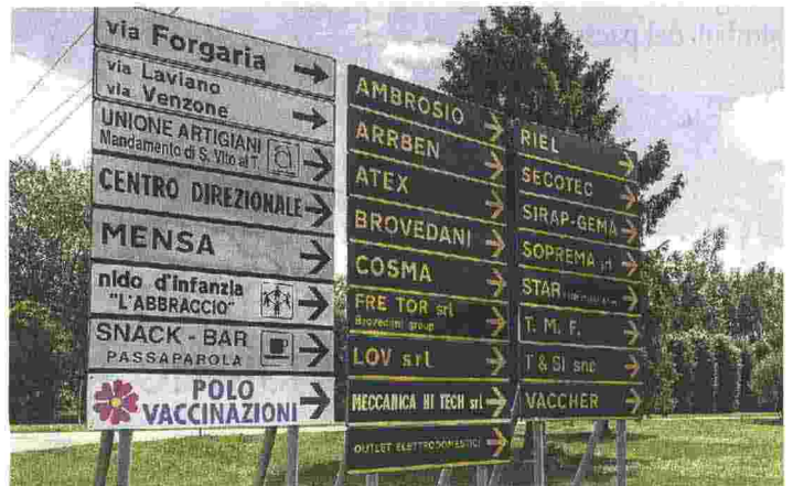
ZONA INDUSTRIALE Busta paga più pesante per i dipendenti di Alpacem Cementi e Alpacem Calcestruzzi, ma i titolari non vogliono mettere in piazza le cifre: si tratta di un bonus per gli ottimi risultati ottenuti dalle due imprese