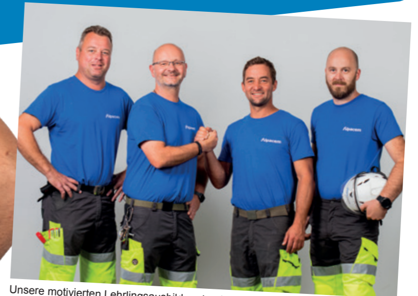
Unsere motivierten Lehrlingsauszubildner begleiten dich auf deinem Erfolgsweg.

Wie wertvoll die Ausbildung in technischen Lehrberufen ist, erkennt man auch daran, dass inzwischen die Meisterprüfung dem akademischen Bachelor gleichgestellt ist. Natürlich steht auch dir nach der Gesellenprüfung der Weg zum Meister oder zu vielen anderen Zusatzqualifikationen offen: Für noch mehr Erfolgchancen am Arbeitsmarkt und im Betrieb.