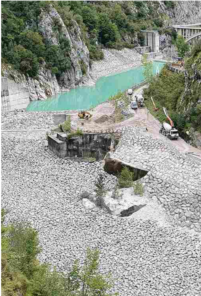
Per movimentare questi massi sono stati impiegati particolari automezzi con cassone iper-corazzato.